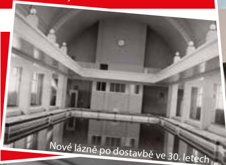
Nové lázně po dostavbě ve 30. letech