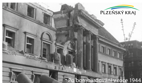
Po bombardování v roce 1944

V rámci obnovy dostane budova nový kabát se zelenou střechou. Hlavní vstup bude dle návrhu vizualizace zachován, ale také bude možné do prostor vstupovat z mnoha míst. Ve druhém podlaží jsou navrženy prostory galerie a hlavního multifunkčního sálu s balkónem, který vznikne v místě bývalého bazénu. Mezi sálem a novým výstavním křídlem je v návrhu terasa a zelená zahrada. V ostatních podlažích jsou navrženy velký konferenční sál, prostory pro organizace zřizované Plzeňským krajem a kavárna s jedinečným výhledem na historické centrum Plzně.