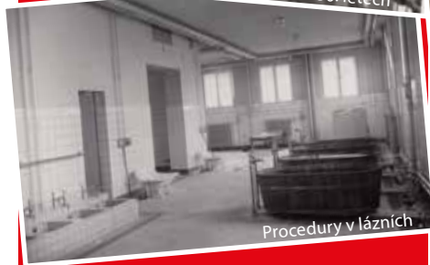
Procedury v lázních