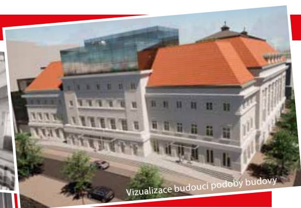
Vizualizace budoucí podoby budovy