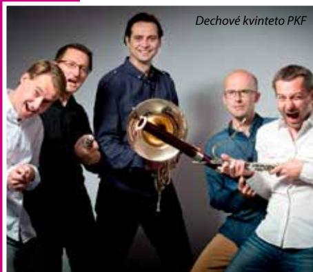
Dechové kvinteto PKF

Jeho tvorbu uvedla také Plzeňská filharmonie, Sojkovo kvarteto, pražský soubor Konvergence, ruský Mo-IoT-ensemble a další. V říjnu 2020 řídil při premiéře svého cyklu „Not Too Much jazz“ známý Jazz Dock Orchestra v pražském divadle Archa.