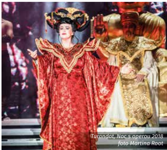
Turandot, Noc s operou 2018

Vstupenky v rozmezí od 200 Kč do 650 Kč budou v prodeji od 9. března v divadelních pokladnách, na webových stránkách divadla djkt.eu nebo v síti Plzeňská vstupenka. Pro abonenty DJKT jsou vstupenky se slevou 20 % již v prodeji.