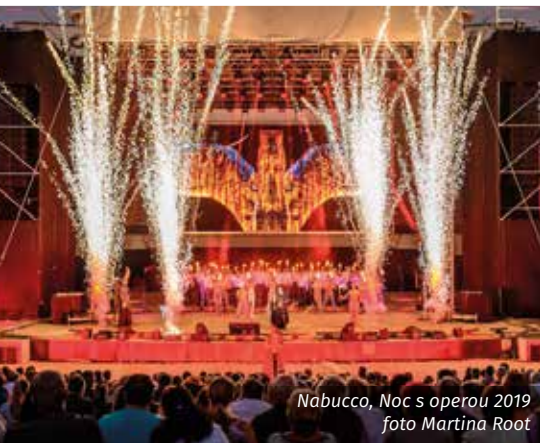
Nabucco, Noc s operou 2019

Pro milovníky opery i nevšedních zážitků chystá Divadlo J. K. Tyla již šestý ročník zcela mimořádného projektu Noc s operou , který 26. června 2020 v prostředí lochotínského Amfiteátru představí slavnou operu Giuseppe Verdiho Macbeth .