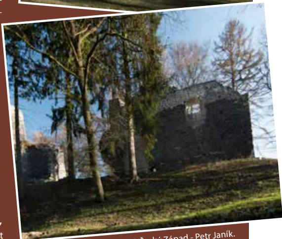
Volfštejn, fotografie (C) MAS Český Západ - Petr Janík.